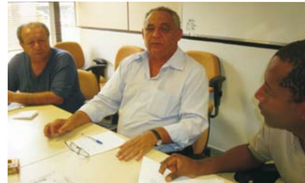
Reunião na EBC para discutir o projeto do PCCS