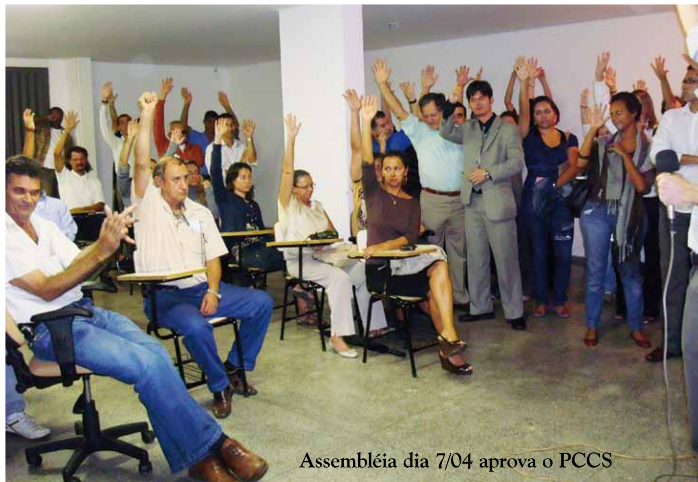
Assembléia dia 7/04 aprova o PCCS

O Sindicato dos Radialistas foi firme na posição de se definir os pisos salariais e a correção de injustiças cometidas ao longo de gestões anteriores com relação a promoções. Vencidas todas essas etapas, chegamos a um consenso com o pré-alinhamento com atualização do enquadramento da tabela da Radiobrás, que significa uma referência a cada dois anos traba-